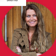
Solveig Moldrheim Raftostiftelsen