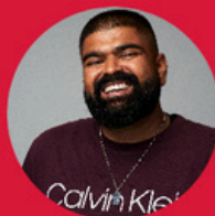
Abu Hussain Med All Respekt