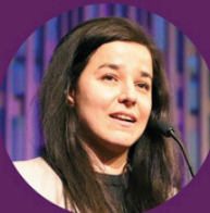
ZAINEB AL-SAMARAI Idrettspresident Norges idrettsforbund

6. september - Media City Bergen kl 18-20 - pris 100,-